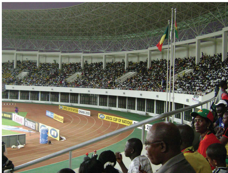
上海建工承建的作用作2008年非洲杯比赛场地的体育场