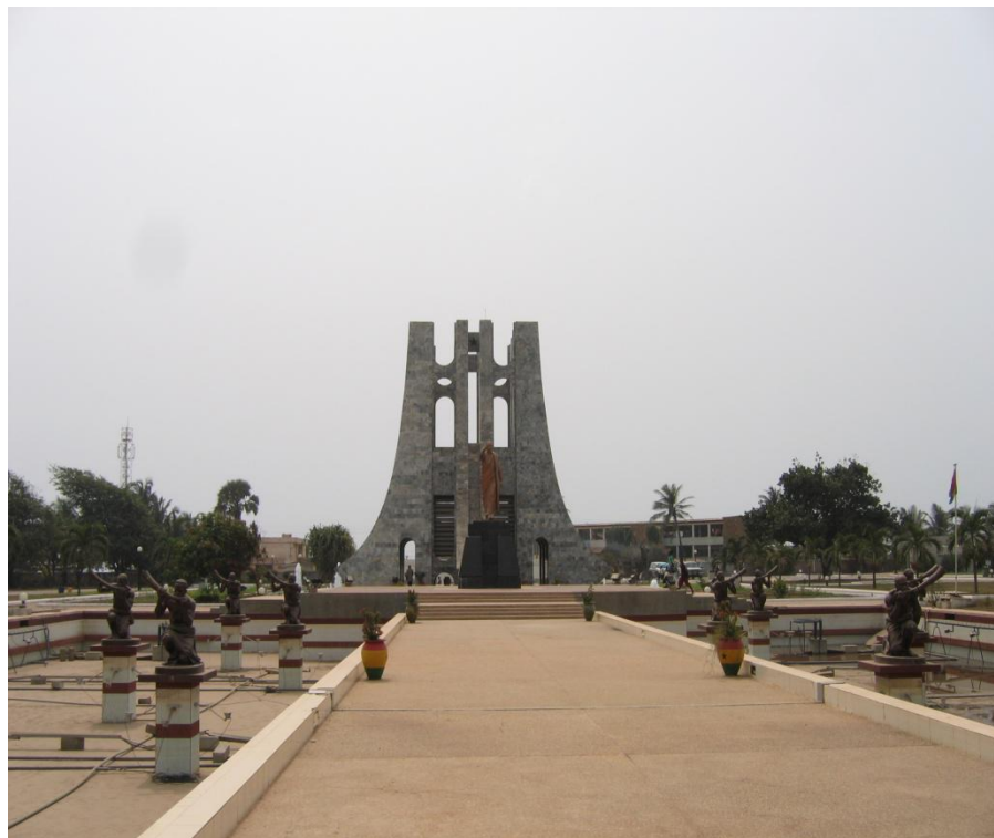
加纳标志性名胜古迹——恩克鲁玛陵园

加纳海岸线长562公里，沃尔特河贯穿南北，渔业资源丰富。加纳森林覆盖面积约495万公顷，占国土面积的22%。