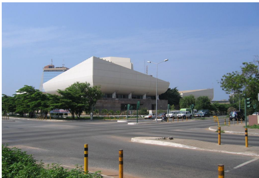
加纳首都标志性建筑——加纳国家剧院外景