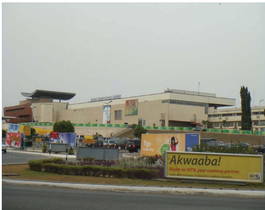
加纳科托卡国际机场