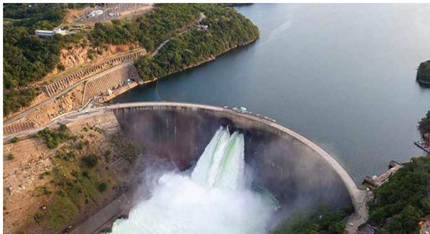
卡里巴南岸水电站

卡里巴南岸水电站地处南部非洲中心地带，其电网与赞比亚、莫桑比克和博茨瓦纳等周边国家互联互通。