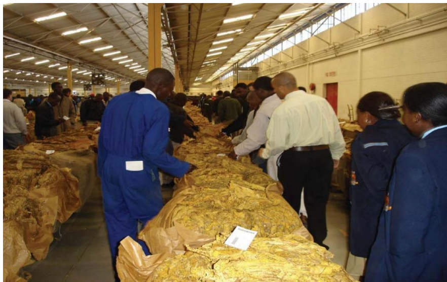
哈拉雷烟草拍卖行

津巴布韦人喜好文化、艺术、歌舞等，石雕更是闻名于世。凡遇到喜庆节日，妇女均会穿上民族盛装，载歌载舞，气氛非常活跃。