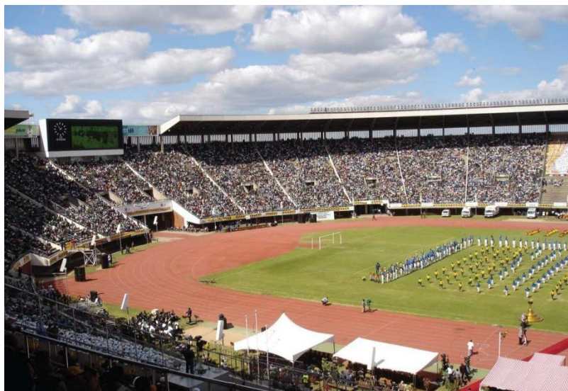
哈拉雷国家体育场

【司法机构】法院体制分4级：最高法院、高等法院、地方法院和初级法院、最高法院是终审上诉法庭。津巴布韦全国司法首脑为首席大法官，也是宪法法院和最高法院的首脑，由总统任命。现任首席大法官卢克·马拉巴（Luke Malaba），总检察长普林斯·马查亚（Prince Machaya）。